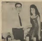
Anzoe Croes di Angochi 8, Sta Cruz